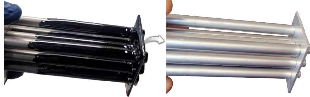
Heavy Hydrocarbon, Asphaltene, Tar / Dip 2~4hr / @80~90°C